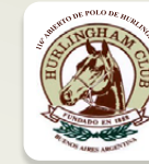
116° ABIERTO DE POLO DE HURLINGHAM