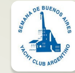
SEMANA DE BUENOS AIRES YACHT CLUB ARGENTINO