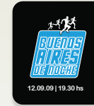
MARATON BS. AS. DE NOCHE