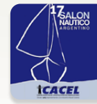
17° SALÓN NAUTICO ARGENTINO